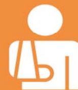
Tavola 2 – Distribuzione dei premi Infortuni per garanzia e per tipologia di premio