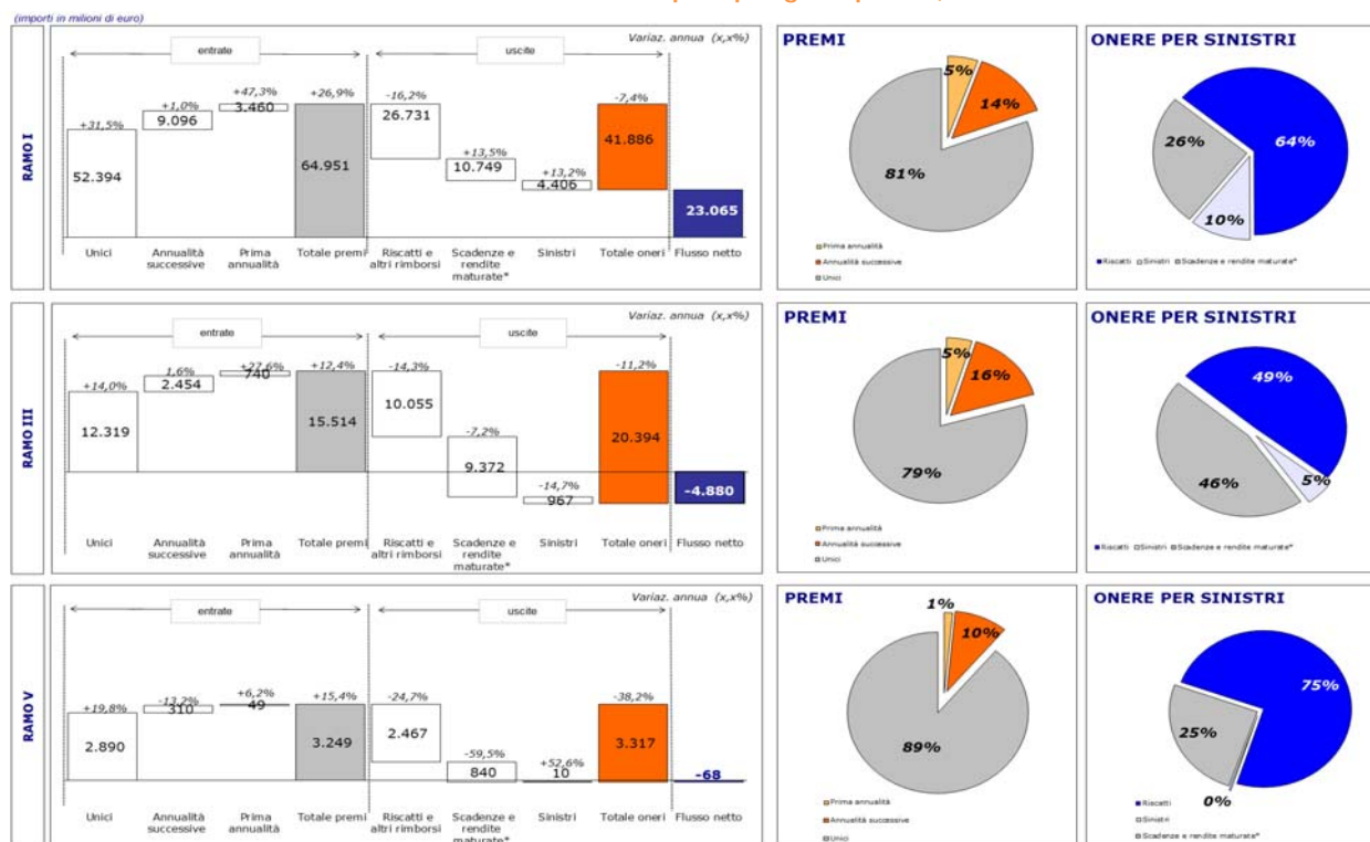
Fig. 2 - Flussi di entrate-uscite cumulati da inizio anno distinti per tipologia di premio, voce di uscita e ramo

Relativamente al ramo III , nel 2013 la raccolta netta, sia pur negativa per € 4,9 mld, ha tuttavia registrato un netto miglioramento rispetto all'analogo periodo degli ultimi quattro anni. Tale risultato è dovuto all'aumento del volume premi contabilizzato (+12,4% rispetto al 2012, a fronte di un ammontare pari a € 15,5 mld) e alla discreta riduzione dell'11,2% del totale oneri per sinistri, pari a € 20,4 mld. Relativamente al singolo trimestre, il flusso netto conseguito nel IV trimestre 2013 è stato pari a € -1,7 mld, in continuo lieve peggioramento da inizio anno (cfr. Allegati). L'onere complessivo per riscatti, scadenze e sinistri ha rappresentato nel ramo III il 22,7% delle riserve.