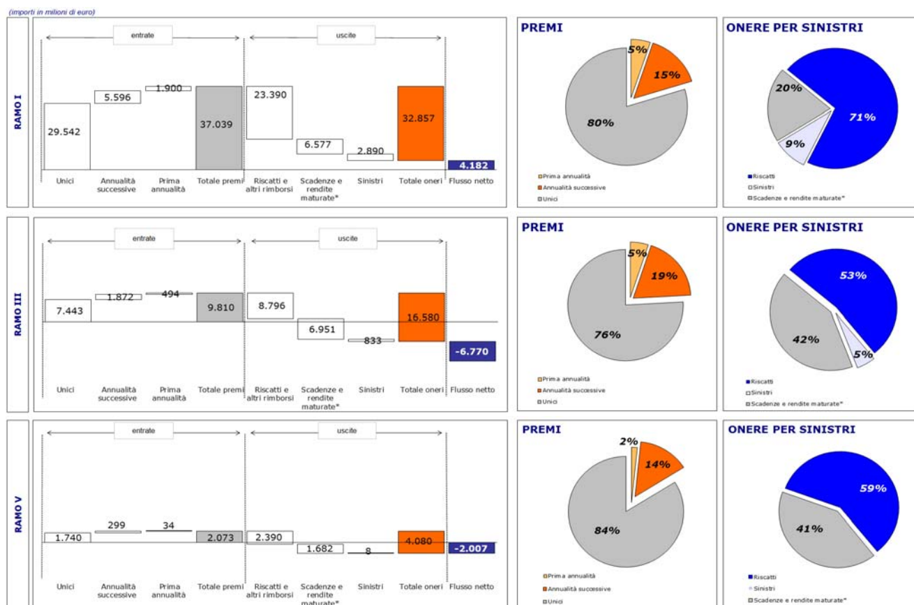
Fig. 2 - Flussi di entrate-uscite cumulati da inizio anno distinti per tipologia di premio, voce di uscita e ramo

(*): comprende anche la riserva per somme da pagare